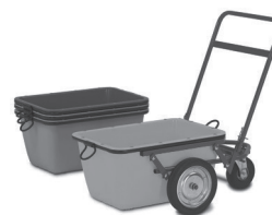
Chariot et bac vendu séparément