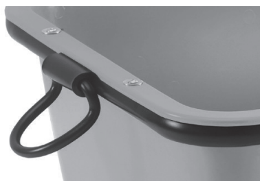
Poignée d'élinguage pour le transport à vide